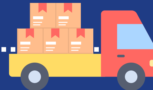
Alle artikelen naar de juiste locatie