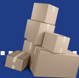
Geen dubbele verkopen