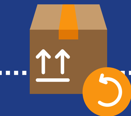
Automatische retouren & creditatie

Minder werk voor jou én een tevreden klant!