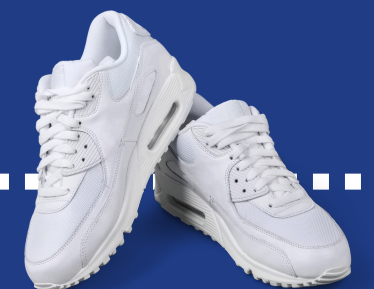
Bewerk zelf producteigenschappen