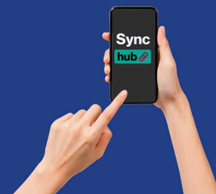
In eigen beheer

Geen gedoe meer met complexe instellingen, gewoon simpel en snel.