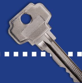
Tokens & versleuteling