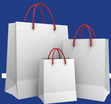
Online bestelling plaatsen

Alsof je er een paar extra handen bij hebt gekregen!