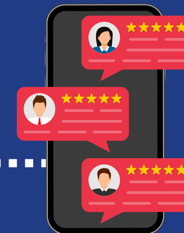
Tevreden klanten als resultaat