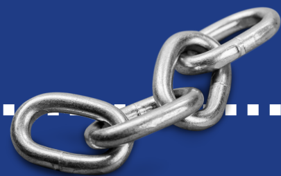
Sync Hub koppeling

Bovendien zorgt de dagelijkse update ervoor dat eventuele voorraadfouten elke 24 uur worden rechtgezet, zo weet je altijd precies wat er in de schappen ligt.