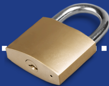
Data optimaal beveiligd

Zoals het hoort bij een goede koppeling!