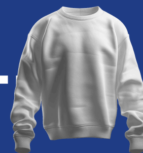
Catalogus automatisch geüpdated